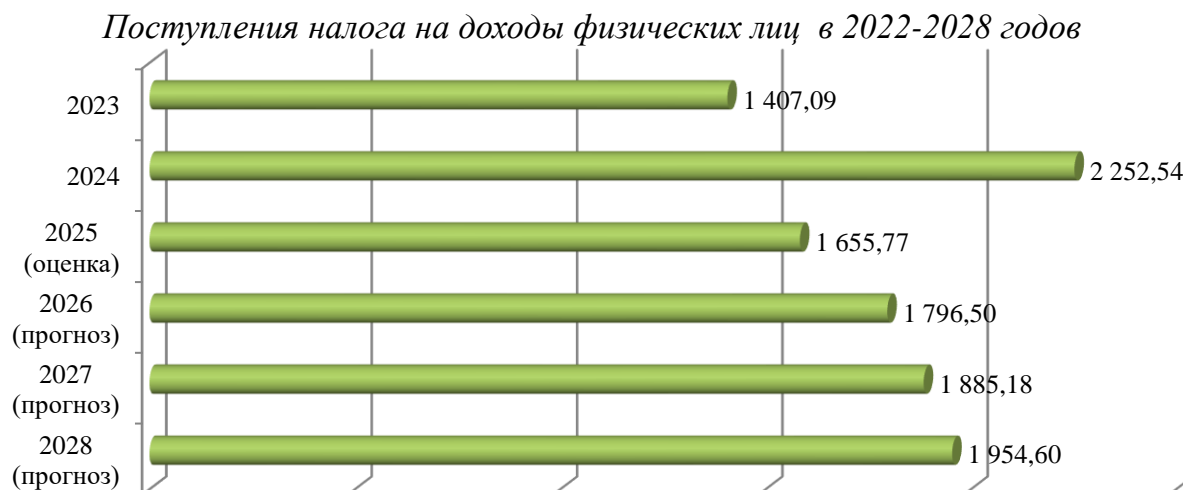
Диаграмма 3, тыс. руб.

При этом отмечается, что прогнозные данные главного администратора доходов на 2026 год использованы не в полной мере. По данным Управления Федеральной налоговой службы по Ленинградской области в поселении поступление налога на доходы физических лиц прогнозируется: